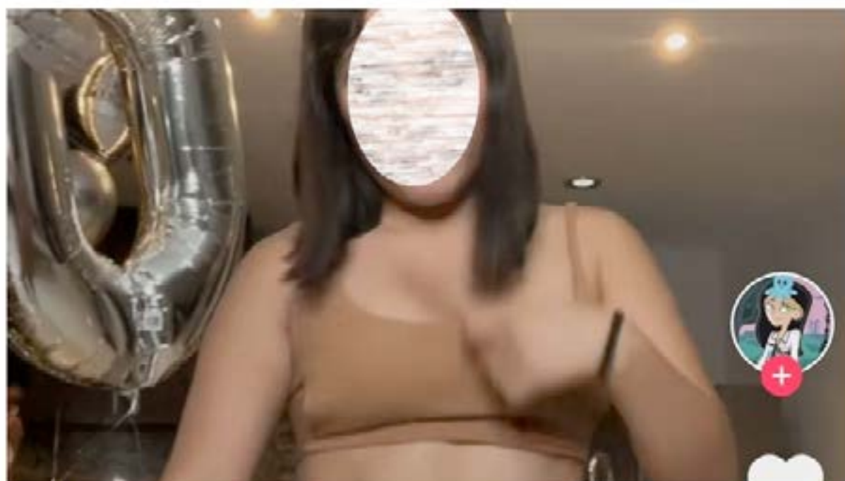
Una publicació en Instagram.