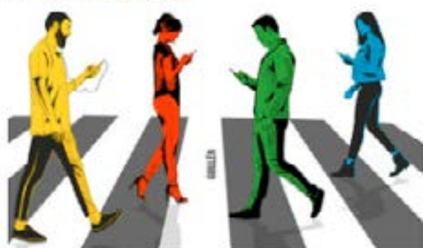
Ilustración de Miguel Guillén.